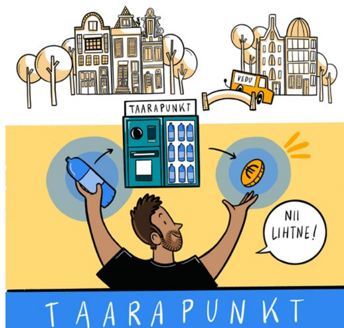
Pilt kampaaniast We Choose Reuse

Tegu on võrdlemisi lihtsa süsteemiga, mida kasutatakse kogu Euroopas üha rohkem. Oluline on aga välja tuua, et paljudes kohtades eksisteerivad pandipakendisüsteemid vaid linna tasandil - näiteks kohalikud topsiringid. Selleks, et olulist mõju avaldada ja